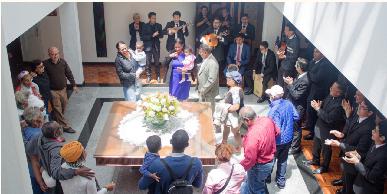
Foto: Seminaristas recibiendo a los hermanos que visitaron el Seminario.

E l pasado 26 de octubre de 2025, recibimos con mucha alegría en el seminario la visita de los hermanos de la Primera Comunidad de San Martín de Porres de Esmeraldas. Desde su llegada, el ambiente se llenó de fraternidad y entusiasmo, reflejo de la comunión que compartimos en la fe. Durante la visita, les mostramos la casa, recorriendo los distintos espacios donde vivimos, oramos y estudiamos. Aprovechamos también para explicarles la nueva estética del seminario, que busca expresar de manera más profunda la belleza y el sentido espiritual de la vida comunitaria. Posteriormente, dos seminaristas ofrecieron una catequesis, compartiendo una reflexión que invitó a todos a renovar el compromiso con la vocación y el servicio a la Iglesia. Antes del almuerzo, rezamos juntos la Hora Media, momento de oración que fortaleció aún más el espíritu de comunión entre todos los presentes.