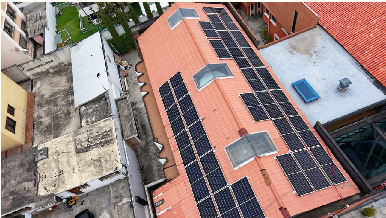
Foto: Vista del proyecto de los paneles solares finalizado.

C on gran alegría comunicamos que el proyecto de instalación de paneles solares en nuestro Seminario ha sido concluido satisfactoriamente. Esta importante obra marca un nuevo paso hacia la sostenibilidad y el cuidado de la casa común, permitiendo aprovechar de manera responsable los recursos naturales que Dios pone a nuestro alcance.