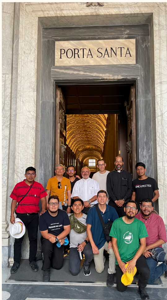
Foto: Seminario en la Basílica de Santa María la Mayor.