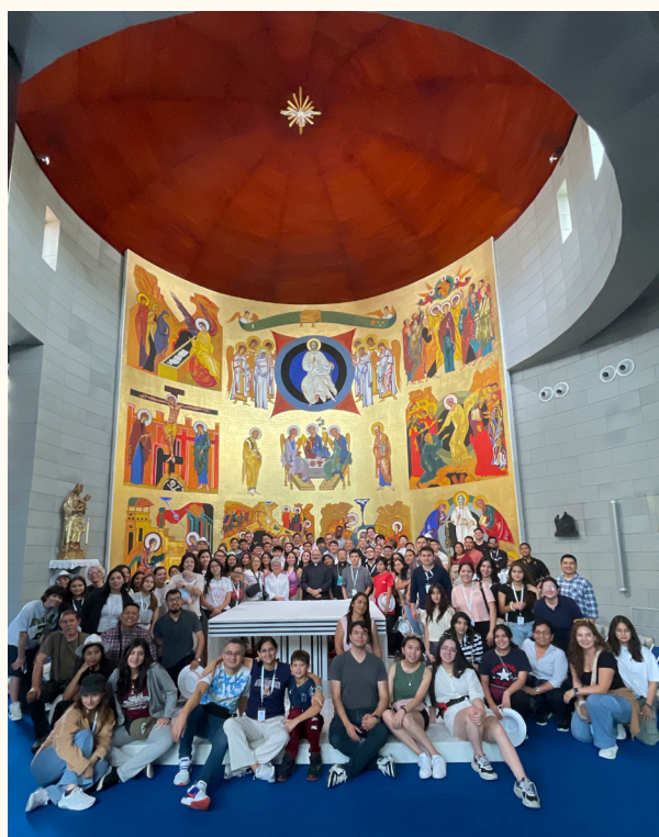
Foto: el grupo de peregrinos en la Capilla del S.R.M de Madrid

Después de pasar una mañana en Milán con su espectacular Duomo (Catedral), nuestra peregrinación nos llevó a visitar también Schio – donde se encuentra el cuerpo de santa Josephina Bakhita, Venecia, con su riqueza espiritual y artística, Padua, donde veneramos las reliquias de San Antonio, Asís, Loreto, lugar de la Basílica de la Santa Casa, San Giovanni Rotondo, donde reposa el cuerpo de san Pio de Pietrelcina, y Monte Sant'Angelo, Pompeya, Roma, Montefiascone y Bolsena, Florencia, Pisa, con su emblemática torre inclinada; Siena, tierra de Santa Catalina y Empoli, cada una con su huella particular en nuestra ruta de fe. Esta peregrinación la realizamos junto a hermanos del Camino Neocatecumenal, en su mayoría jóvenes provenientes de distintas comunidades de Quito y Guayaquil. Con ellos compartimos cantos, celebraciones, cansancio y alegría, experimentando la comunión de la Iglesia en camino.