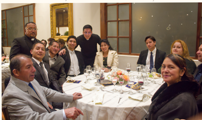
Foto: Seminaristas junto a hermanos en la Cena de Gala.