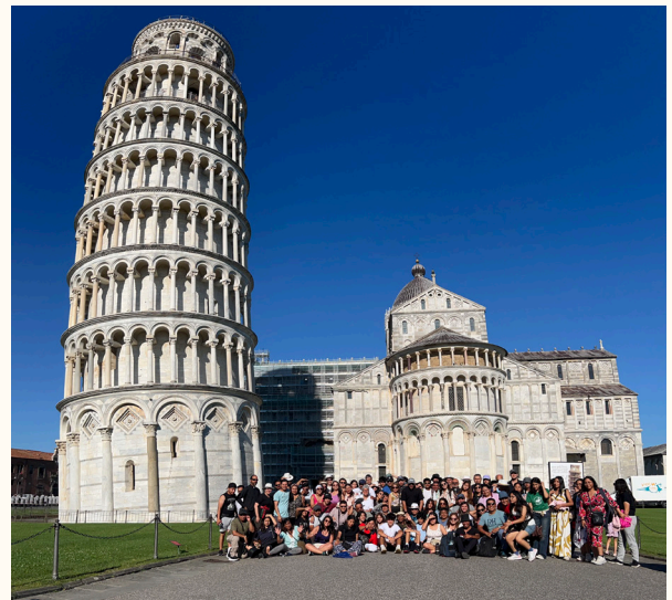
Foto: Grupo de Peregrinos en Pisa, junto al famoso campanario.

L es aseguramos a todos nuestro agradecimiento más profundo y nuestras oraciones y les pedimos que sigan rezando por nosotros, para que podamos responder fielmente al llamado que Dios nos ha hecho y ser, algún día, pastores según su corazón. Que todo sea para la gloria de Dios y el bien de la Iglesia.