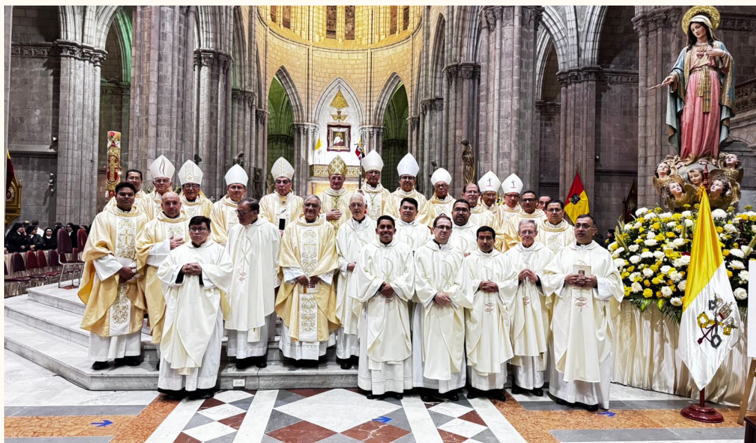
Foto: Obispos y Sacerdotes durante la celebración en agradecimiento por la elección del Papa León XIV.