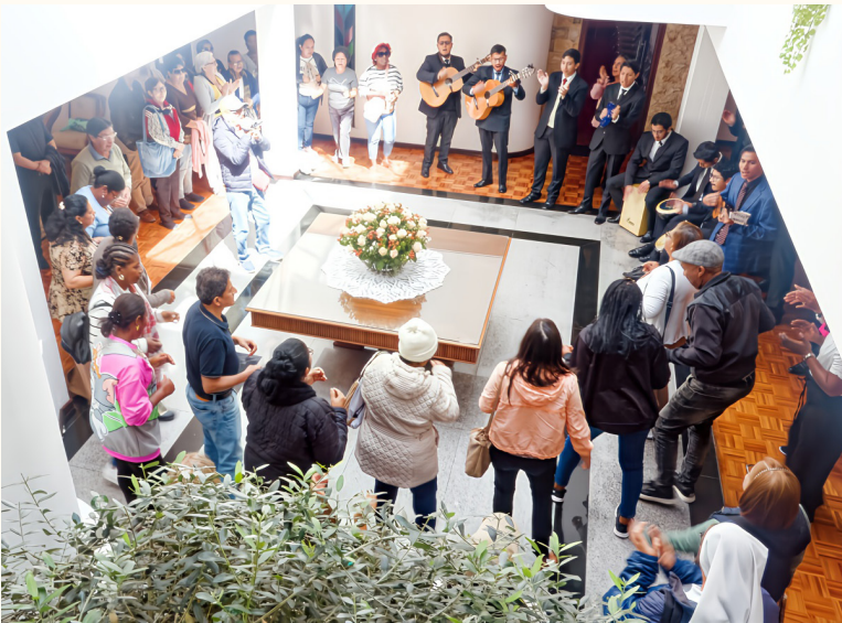
Foto: El Seminario recibió con alegría a los peregrinos.

E l 31 de agosto, tuvimos la alegría de recibir la visita de un grupo de peregrinos provenientes de la parroquia de San Martín de Porres en Esmeraldas, quienes se dirigían hacia su destino final en Lima, Perú. Los recibimos con mucho entusiasmo, compartiendo un momento fraternal con ellos. A lo largo de su visita, pudimos disfrutar de un ambiente lleno de camaradería, intercambiar experiencias y agradecerles profundamente por su esfuerzo y dedicación en esta peregrinación, pidiendo al Señor que siga guiando su camino.