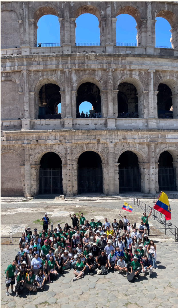
Foto: Peregrinos junto al Coliseo Romano