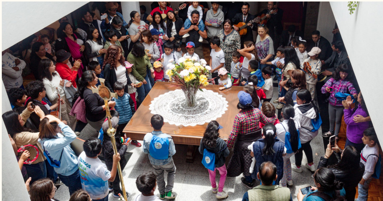
Foto: Los niños y sus padres danzando en el Seminario.

El 20 de septiembre de 2025 tuvimos la alegría de recibir la visita de un grupo de niños provenientes de distintas parroquias de Quito, quienes celebraban con entusiasmo el Jubileo de los Niños. Su presencia llenó de vida y esperanza nuestra casa de formación, recordándonos la sencillez y la pureza con la que todos estamos llamados a vivir la fe.