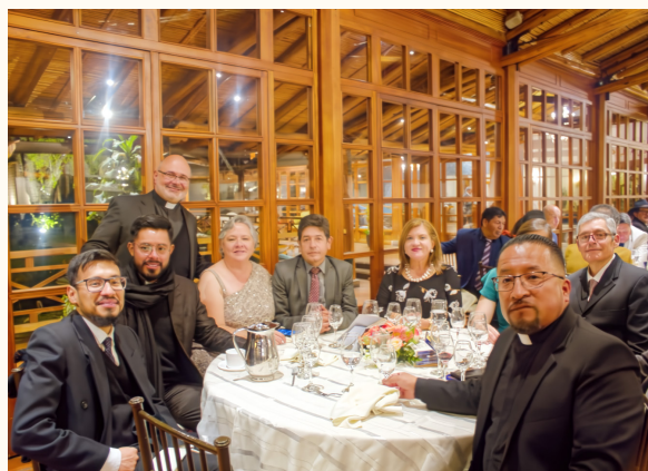
Foto: Seminaristas compartiendo con hermanos en la Cena.