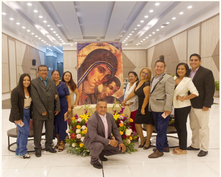
Foto: Hermanos de distintas Parroquias de Guayaquil asistieron a la Cena de Gala.