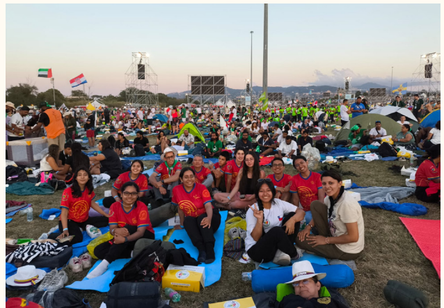
Foto: Peregrinos en la Vigilia con el Papa León XVI en Tor Vergata