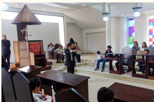
Foto: Niños peregrinos recibiendo catequesis en el Santuario de la Palabra.

Luego de la bienvenida, les ofrecimos un refrigerio, donde pudimos compartir momentos de diálogo, risas y cercanía fraterna. Finalmente, los acompañamos en un recorrido por las distintas áreas del Seminario, brindándoles catequesis adaptadas a su edad, explicándoles el significado y la misión de cada espacio: la capilla, los salones de estudio, el comedor, la Capilla y el Santuario della Palabra. Fue para nosotros una hermosa oportunidad de transmitirles el amor a Dios y el sentido de nuestra vocación misionera.