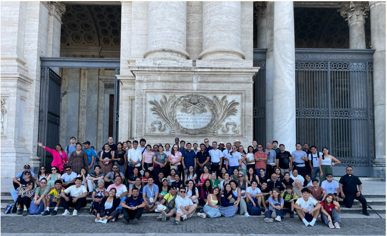
Foto: Peregrinos del jubileo en la basílica de San Juan en Letrán, Roma, Italia.