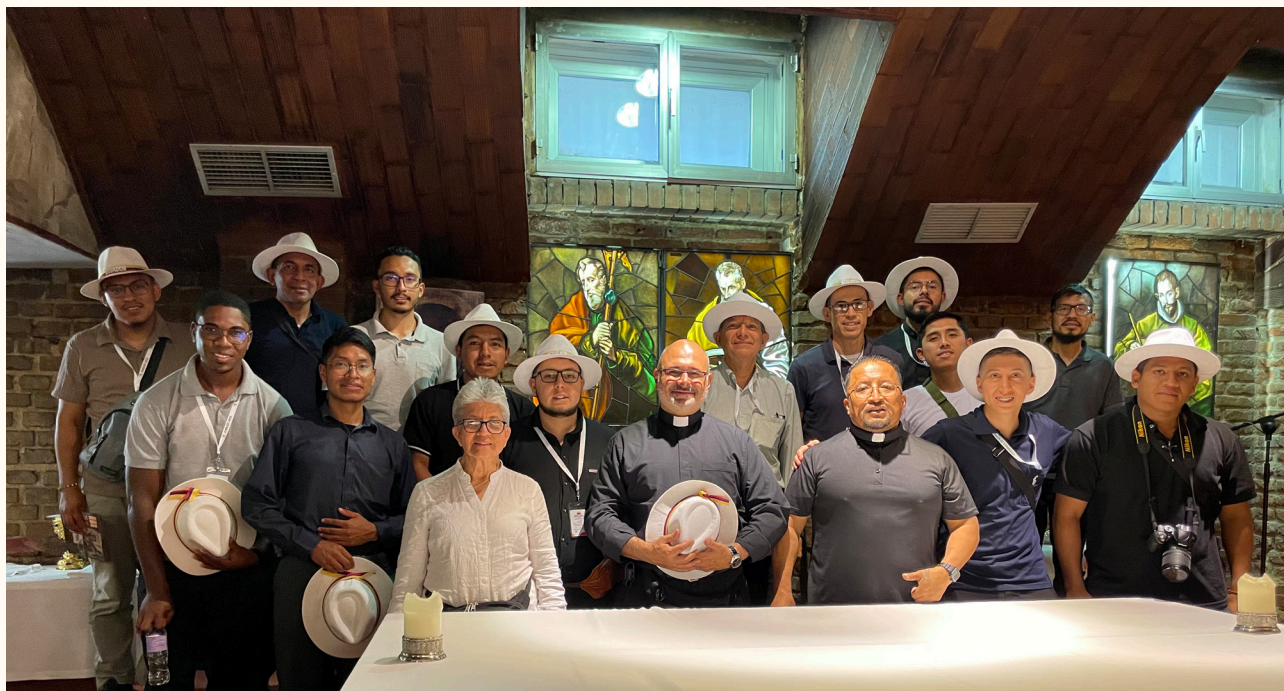
Fotos: Al iniciar la peregrinación visitamos la casa de Kiko en Madrid.

Con profunda gratitud al Señor, queremos compartir la experiencia de fe que vivimos durante los meses de julio y agosto, al participar como seminario en la peregrinación que culminó con el Gran Jubileo de los Jóvenes en Roma. Nuestro viaje nos llevó por diversas ciudades de Italia, recorriendo lugares llenos de historia, belleza y santidad. Después de quedarnos unas horas en Madrid donde pudimos visitar la casa de Kiko en Madrid – con su habitación donde tuvo la visión de la Virgen María que le invitaba a hacer comunidades cristianas como la Sagrada Familia de Nazaret – y el seminario Redemptoris Mater , nuestro itinerario en Italia empezó en Turín: aquí visitamos la capilla de la Sábana Santa, la iglesia de Santa María Auxiliadora y la Piccola Casa della Divina Provvidenza del Cottolengo.