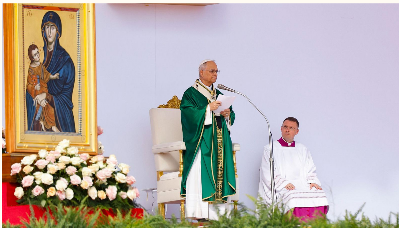
Fotos: El Santo Padre León XIV presidió la eucaristía del Gran Jubileo de los Jóvenes.

El momento central de nuestro viaje fue la llegada a Tor Vergata, donde fuimos partícipes del Gran Jubileo de los Jóvenes. Allí, en una vigilia de oración inolvidable, acompañamos al Papa León XIV, quien nos exhortó a no tener miedo de seguir a Cristo con radicalidad y alegría. Cientos de miles de jóvenes de todo el mundo nos unimos en un solo espíritu, para alabar al Señor y renovar nuestra fe bajo el cielo estrellado de Roma. Al día siguiente, participamos con gozo en la Santa Misa presidida por el Santo Padre, momento cumbre en el que, como comunidad eclesial, celebramos la Eucaristía en la unidad de la fe y la diversidad de nuestros orígenes.