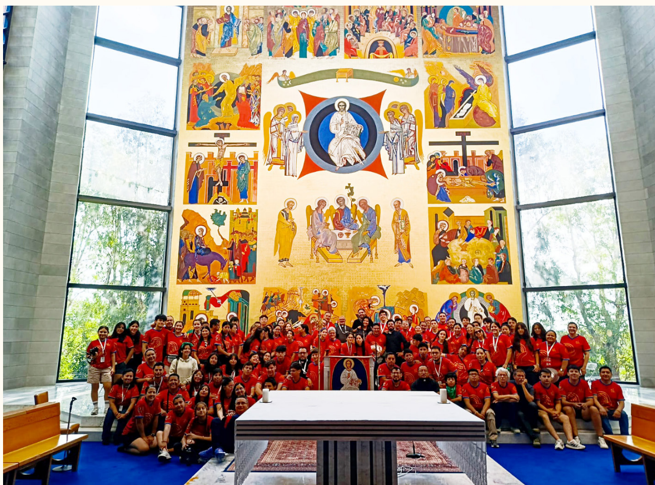
Foto: Grupo de peregrinos visitando la capilla del S.R.M de Roma durante el Gran Jubileo de los Jóvenes.