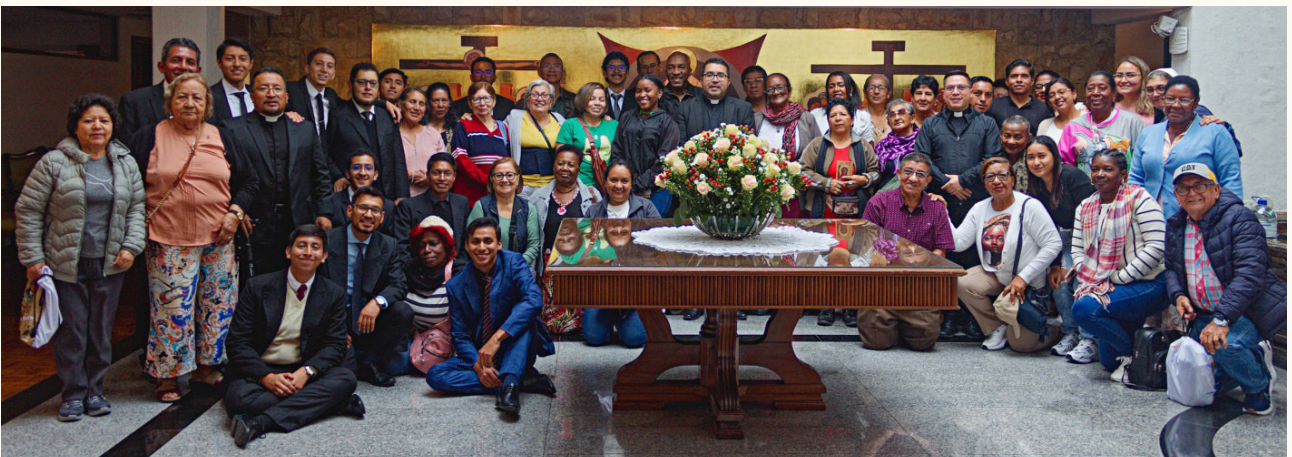
Foto: Peregrinos y miembros del Seminario juntos al finalizar la visita.

R ezamos al Señor por estos hermanos que nos han visitado y por sus oraciones, que nos apoyan cada día en nuestra formación. Que la gracia del Padre los fortalezca y los aliente en su misión, y que sigan siendo testigos de la fe en su camino.