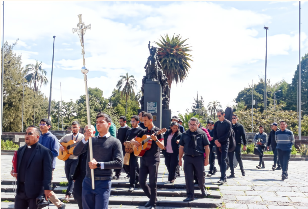
Foto: Emprendimos nuestra peregrinación hasta la Basílica del Voto Nacional.

E n la mañana del 18 de octubre de 2025, realizamos una peregrinación hacia la Basílica del Voto Nacional, en la ciudad de Quito. Durante el recorrido cantamos el Rosario en honor a la Virgen María, elevando nuestras oraciones por la paz en el país, por las vocaciones sacerdotales y por la misión evangelizadora de la Iglesia. Al llegar a la Basílica, cruzamos la Puerta Santa con motivo del Jubileo, viviendo con alegría y gratitud este signo de gracia y reconciliación.