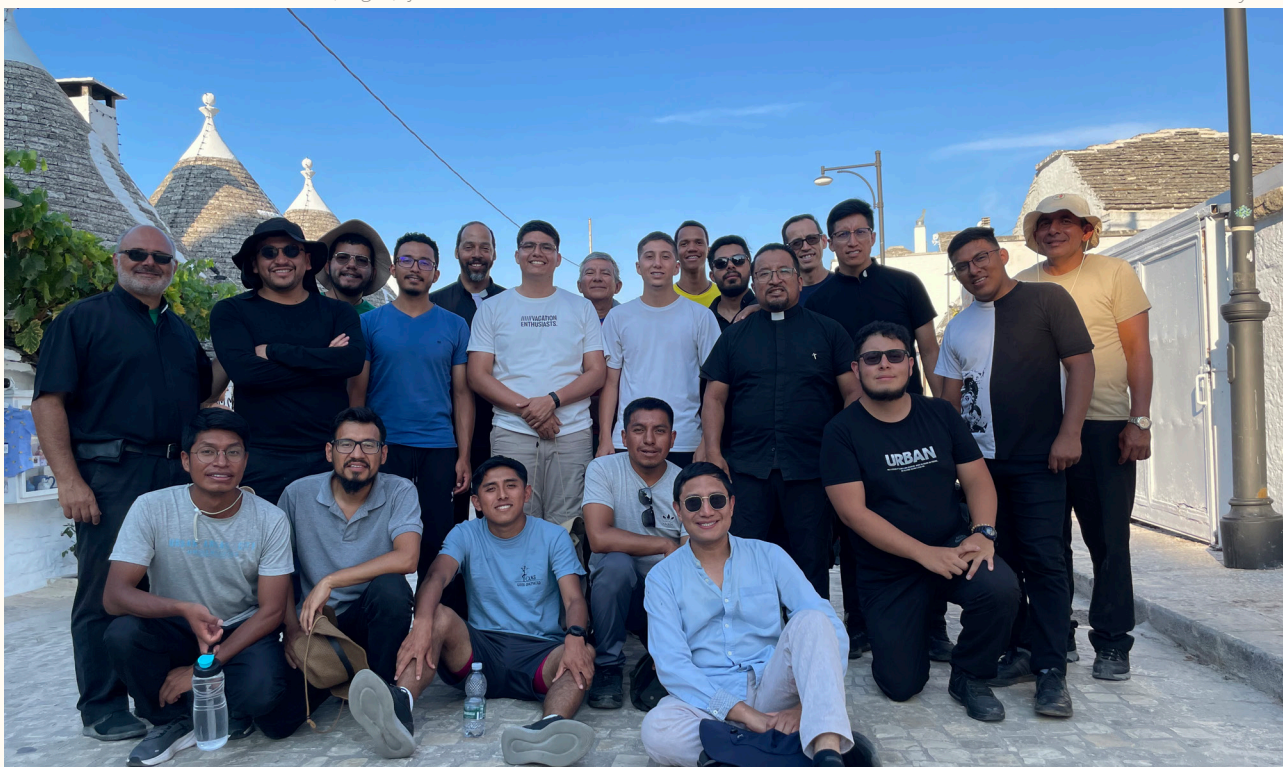
Foto: Seminario en Alberobello, (Puglia), visitamos los famosos "Trulli".