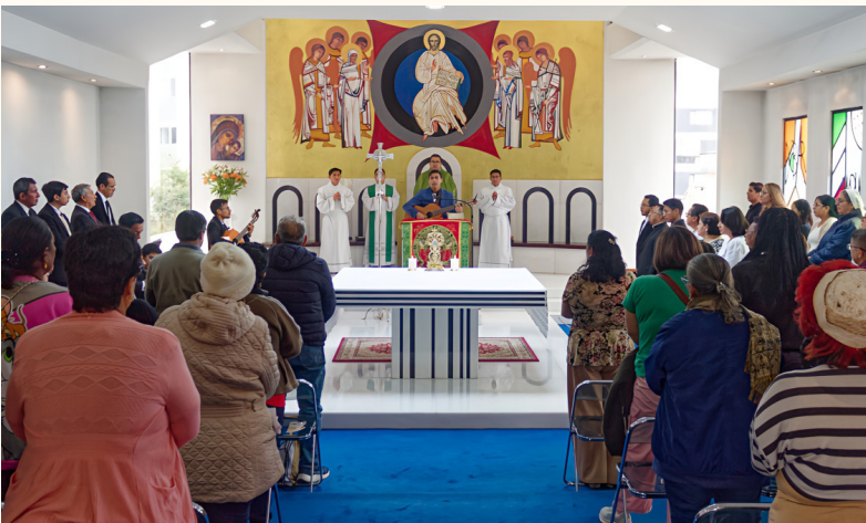
Foto: Celebración de los laudes junto a los peregrinos.