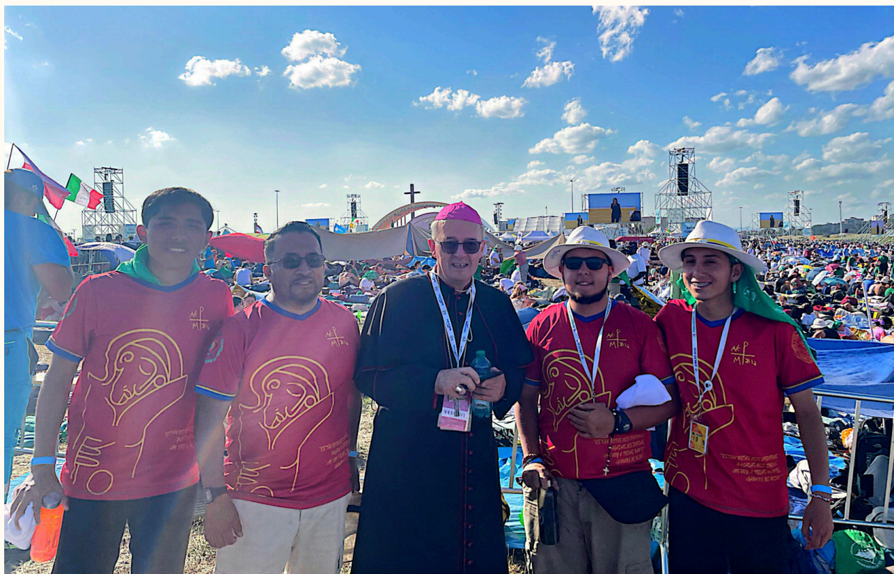
Seminaristas junto al obispo de Manfredonia-Vieste-San Giovanni Rotondo durante el encuentro en Tor Vergata

El momento central de nuestro viaje fue la llegada a Tor Vergata, donde fuimos partícipes del Gran Jubileo de los Jóvenes. Allí, en una vigilia de oración inolvidable, acompañamos al Papa León XIV, quien nos exhortó a no tener miedo de seguir a Cristo con radicalidad y alegría. Cientos de miles de jóvenes de todo el mundo nos unimos en un solo espíritu, para alabar al Señor y renovar nuestra fe bajo el cielo estrellado de Roma. Al día siguiente, participamos con gozo en la Santa Misa presidida por el Santo Padre, momento cumbre en el que, como comunidad eclesial, celebramos la Eucaristía en la unidad de la fe y la diversidad de nuestros orígenes.