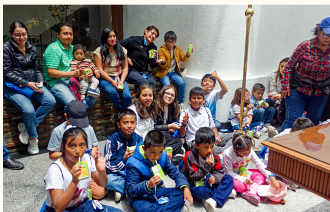
Foto: Servimos un refrigerio a los niños peregrinos.

Concluimos la jornada con un momento de oración, en el que todos, niños, padres y seminaristas, elevamos nuestras súplicas y agradecimientos al Señor por los dones recibidos. Damos gracias a Dios por habernos permitido compartir este encuentro tan especial. Rezamos por estos niños y sus familias, para que el Señor los bendiga y los acompañe siempre, y para que de entre ellos surjan nuevas vocaciones al servicio de la Iglesia y de la evangelización.