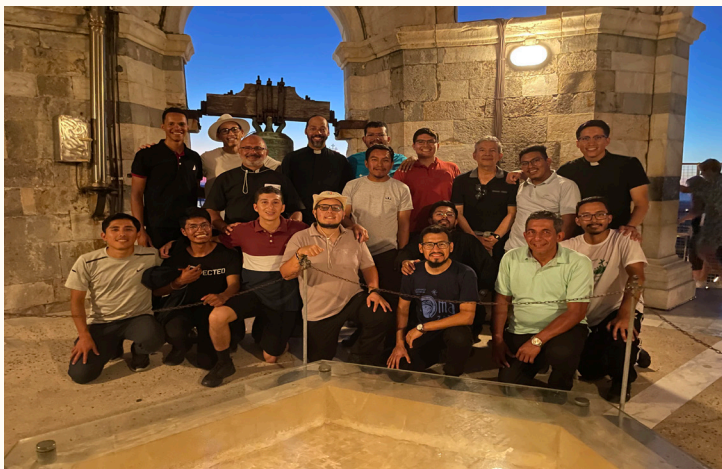
Foto: Seminario en la parte alta de la Torre de Pisa.

F inalizada la peregrinación jubilar, tuvimos un tiempo de vacaciones como seminario en Puglia donde fuimos acogidos por los hermanos de Ginosa y Marina di Ginosa (TA) y Matera: un sincero agradecimiento a todos los que estuvieron tan pendientes de nosotros y nos dieron la posibilidad de vivir unos días inolvidables.